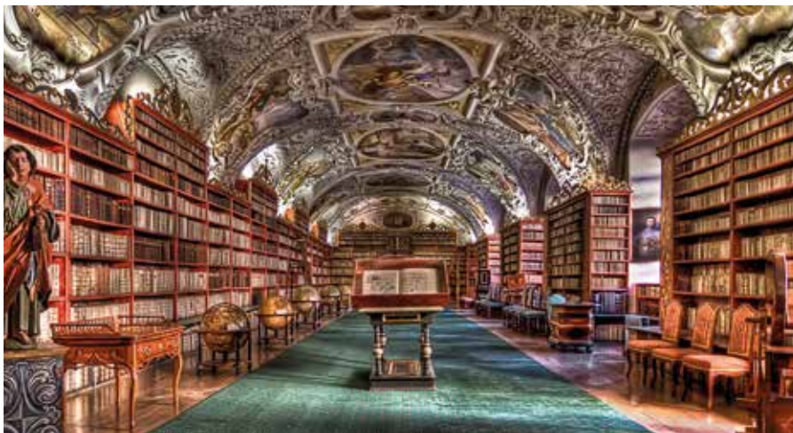
Fraglos eine der schönsten ihrer Art weltweit: die Strahov-Bibliothek im Kloster Strahov.

Im Advent zeigt die Stadt ein weiteres Gesicht: ihre Weihnachtsmärkte. Der bekannteste und größte ist der Markt auf dem Altstädter Ring – das Herz der Festzeit, mit riesigem Baum, Holzbuden, täglichem Begleitprogramm und einer Kulisse von Teynkirche und Rathausuhr, die wie für Winterpostkarten gemacht scheint. Daneben locken der Markt am Wenzelsplatz und jener am Platz der Republik, der stimmungsvolle Burgmarkt am St.-Georgs-Platz mit Blick über die Lichter der Stadt sowie – für ein lokaleres Gefühl – der Markt am Náměstí Míru in Vinohrady, der häufig als erster öffnet. Zwischen Svařák (Glühwein), gerösteten Kastanien, Lebkuchen und herzhaften Snacks wird hier geschlendert, geschaut, geplaudert – Advent, wie er sein soll.