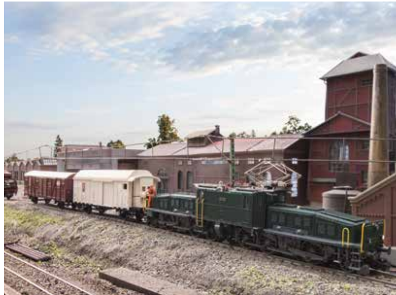
Klassiker vom Erfinder der Modelleisenbahn Märklin: Das „Krokodil“ der Schweizerischen Bundesbahnen

Das Hobby Modelleisenbahn ist konzentrierte Entschleunigung: planen, sägen, löten, programmieren, begrünen – und am Ende fährt etwas, das man selbst geschaffen hat. Die Modelleisenbahn macht Technik begreifbar (vom Dampftriebwerk bis zur E-Lok), ist Gesprächsanlass in der Familie und – dank moderner Digitalsteuerungen – so intuitiv wie nie. Und die Einstiegshürden sind niedrig: Startsets mit Zentrale, Soundlok und robusten Gleisen eröffnen binnen Minuten die erste Runde. Wer will, baut später etappenweise aus: vom Rangierbrett am Schreibtisch bis zur eigenen Keller-Topografie.