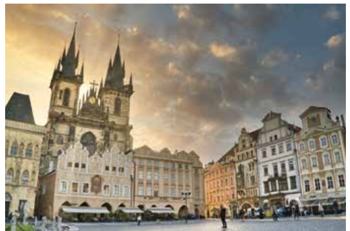
Der Altstädter Ring ist der bedeutendste Platz der Stadt aus dem 12. Jahrhundert