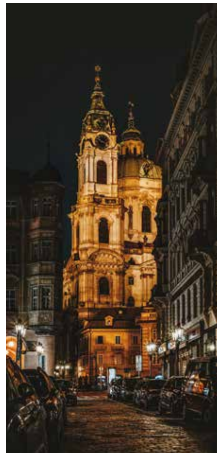
Die St.-Nikolaus-Kirche bei Nacht

Aber Prag ist nicht nur tiefsinnig, sondern auch tief schmackhaft. Kulinarisch bietet die Stadt deftige tschechische Hausmannskost – von Svičková (Rinderbraten in Sahnesoße mit Knödeln) bis hin zu rustikalem Gulasch. Und dazu? Natürlich ein frisch gezapftes Pils – Tschechien ist schließlich das Mutterland des Bieres. Wer es lieber hip als herzlich mag, findet auch dafür Raum: In Stadtteilen wie Žižkov oder Karlin floriert die Szene. Hier trifft Craft-Bier auf Vintage-Möbel, Baristas auf Basslines.