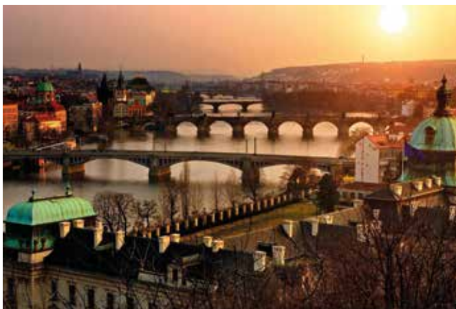
Weltbekanntes Panorama: Die Moldau mit der Karlsbrücke im Vordergrund

Melancholisch, majestätisch, manchmal ein bisschen morbide – all das ist Prag, aber dabei immer magnetisch. Es ist eine Stadt, die sich nicht aufdrängt, sondern einem langsam unter die Haut geht. Zwischen barocken Fassaden und Biergärten, Kafka-Zitaten und Kopfsteinpflaster, Moldauschimmern und Musikfestivals hat Prag etwas, das man nicht mit einem Foto einfangen kann: Charakter. Und den spürt man noch lange, wenn man längst wieder zu Hause ist.