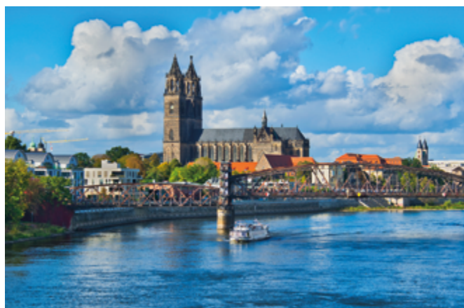
Die Elbe mit Hubbrücke, dahinter der Dom.