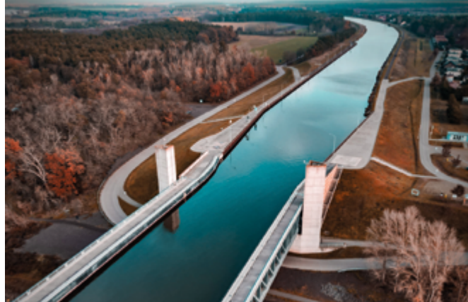
Die Kanalbrücke Magdeburg ist die längste Kanalbrücke Europas.