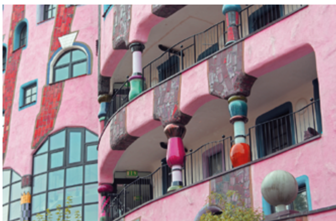
Die Grüne Zitadelle, besser bekannt als das „Hundertwasserhaus“.

Wer andere historische Städte kennt, merkt schnell: Magdeburg erzählt seine Geschichte anders. Statt geschlossener Kulisse mischen sich Domtürme mit Nachkriegsbauten, Hundertwasser-Fassade mit Elbauenpark, Technikgeschichte mit Spitzenhandball. Gerade dieser Kontrast macht den Reiz aus: Zwischen Kirchen und Kanalbrücken, Fangesängen und Elbwiesen erlebt man eine Stadt, die ihre Vergangenheit nicht versteckt, sondern als Kraftquelle für Gegenwart und Zukunft nutzt.