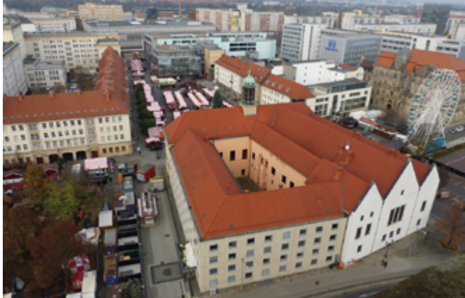
Das Alte Rathaus (Rückseite), das sich am Alten Markt befindet.