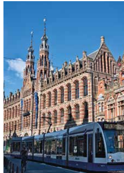
Backstein, Türme, Tram: Amsterdams Hauptbahnhof zieht die Blicke auf sich.

Amsterdam ist längst nicht mehr nur Sehnsuchtsort, sondern auch Beispiel dafür, wie aus beliebt „zu beliebt“ werden kann. 2024 gab es in der Stadt rund 23 Millionen touristische Übernachtungen – und damit mehr als das, was die Stadt eigentlich als Zielmarke ausgerufen hatte. Die Reaktion darauf: Amsterdam versucht, den Massentourismus zu bremsen, etwa mit strengeren Regeln, wie beispielsweise einem Stopp für neue Hotels, wenn sie nicht an anderer Stelle ersetzt werden.