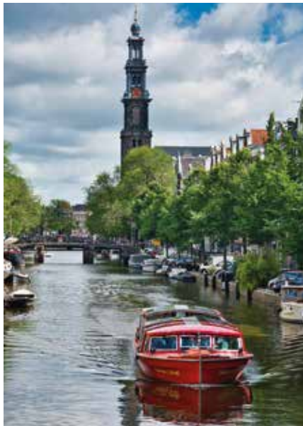
Grachtenboot vor Kirchturm: so malerisch zeigt sich Amsterdam.

Amsterdam bewegt sich auf zwei Rädern. Schätzungen sprechen von rund 881.000 Fahrrädern in der Stadt (bei 935.000 Einwohnern wohlbemerkt)! Diese Zahl trifft das Lebensgefühl ziemlich gut: Du gehst nicht „an Fahrrädern vorbei“, du navigierst durch sie hindurch. Und weil Verkehr hier so allgegenwärtig ist, wird er auch politisch: Zuletzt machte die Stadt etwa mit Maßnahmen gegen besonders schnelle, schwere E-„Fatbikes“ Schlagzeilen – Sicherheit statt