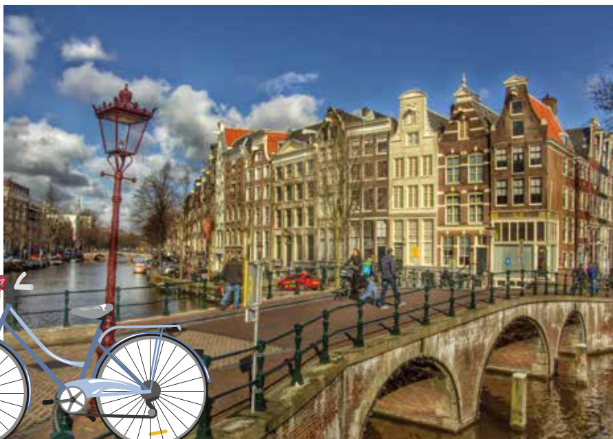
Brücke, Grachten, Giebelhäuser: Amsterdam wie aus dem Bilderbuch.

Vielleicht liegt Amsterdams Magie genau in dieser Spannung: zwischen prachtvoller Vergangenheit und hochaktuellen Debatten, zwischen Museum und Musikclub, zwischen ruhigem Morgenlicht auf der Prinsengracht und dem vollen Gedränge am Nachmittag. Es ist eine Stadt, die nicht nur „schön“ sein will, sondern lebendig – manchmal anstrengend, oft überraschend, fast immer inspirierend. Und wenn du am Ende einer Grachtenfahrt unter einer der vielen Brücken hindurchgleitest, denkst du wahrscheinlich das, was hier viele denken: Einmal reicht nicht.