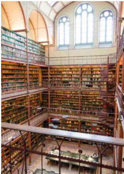
Die Cuyper-Bibliothek im Rijksmuseum verzaubert mit historischem Flair.

abbiegen darf. Klassiker wie Rijksmuseum und Van-Gogh-Museum liefern Weltklasse, aber fast genauso schön ist das, was dazwischen passiert: ein Kaffee in den „Nine Streets“ (jenen 3 x 3 Gassen zwischen der Prinsen-, Keizers- und Herengracht), Vintage in De Pijp, ein Streifzug durchs Jordaan-Gassenlabyrinth – und überall das Wasser als Orientierungslinie.